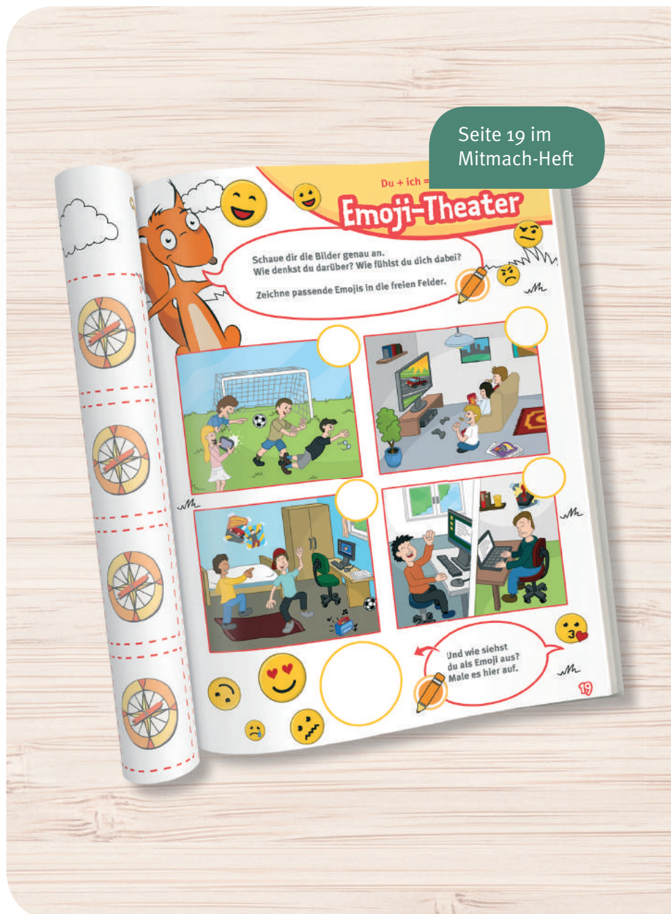
Seite 19 im Mitmach-Heft

Gestalten Sie für die Regeln ein Plakat, das Sie im Klassenzimmer aufhängen können. Dieses kann durch die Emojis der Kinder verziert werden. Das Plakat können Sie alternativ auch am PC mit den Kindern gestalten. Die Regeln können zudem als Fotos oder als Fotostory umgesetzt werden.