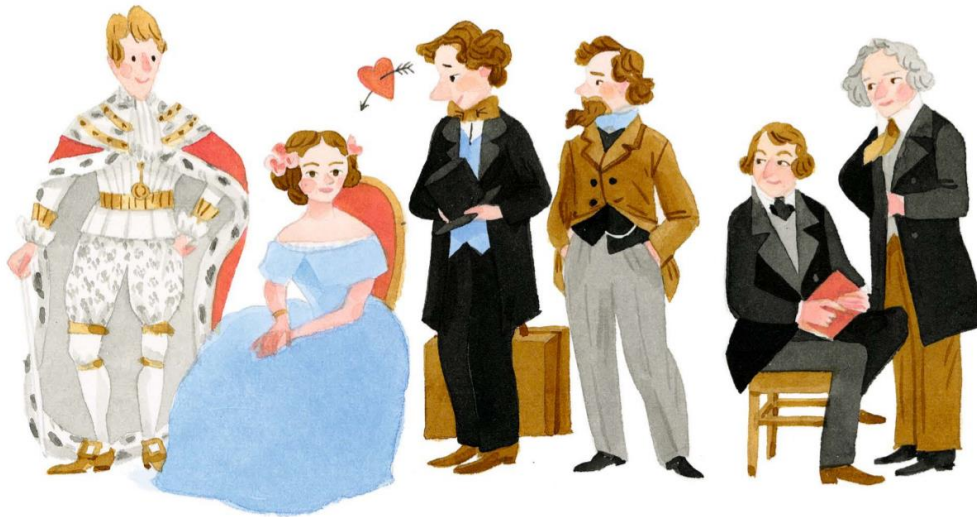
KÖNIG FREDERIK VI